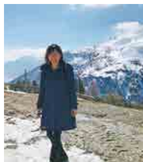
アルプス散歩 ジョージ・クルーニーと?