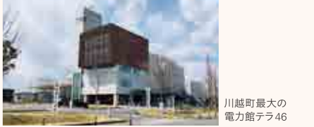
川越町最大の電力館テラ46

落語会が開かれるため、落語に興味をもつ子ども達も少なくありません。このように、子ども達の思い出として強く残るイベントが多くあるのも川越町の魅力だと私は思います。