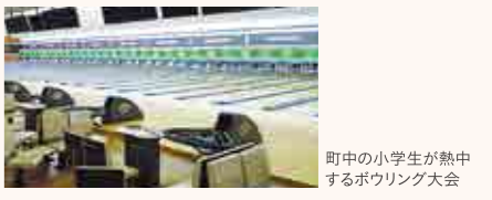
町中の小学生が熱中するボウリング大会