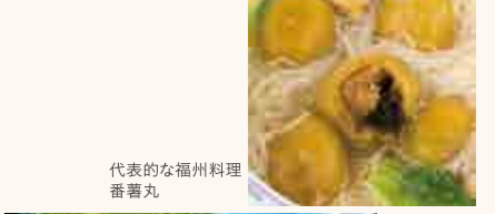
代表的な福州料理 番薯丸