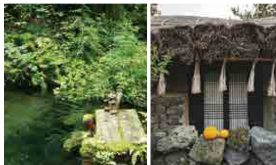
軽井沢の白糸の滝 韓国の濟州(チェジュ)島