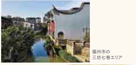
福州市の三坊七巷エリア

在の一階部分は観光客向けの特産品などを販売しています。ぜひ一度きてほしいところです。