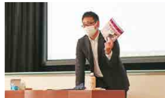
授業では雑誌やマンガをすすめることもあります