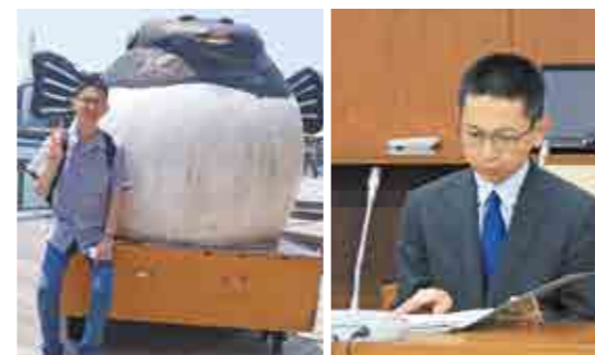
下関旅行の一コマ 若手県議会での講演