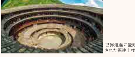
世界遺産に登録された福建土楼