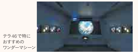
テラ46で特におすすめのワンダーマシーン