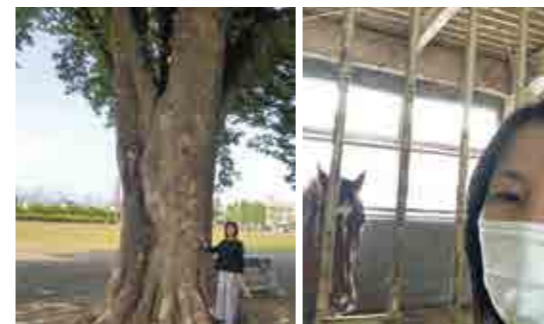
懐かしの樺の木 とときどき行く厩舎の馬と一緒に