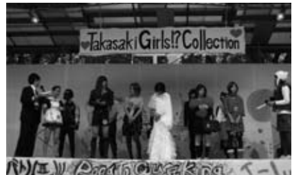
↑実行委員会主催企画のなかでも一際にごわった女装コンテスト「Takasaki Girls!? Collection」

最後になりますが、第51回三扇祭を開催するにあたり、大学関係者をはじめとする沢山の方々にご支援・ご協力頂きました。この場をお借りして皆様に、心より御礼申し上げます。ありがとうございました。