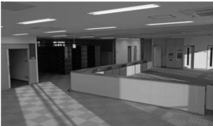
完成したばかりのキャリア支援室(7号館2階)

高崎経済大学大学院 群馬大学大学院 北海道大学大学院 東北大学大学院 宇都宮大学大学院 埼玉大学大学院 一橋大学大学院 東京学芸大学大学院 中央大学大学院 慶應義塾大学大学院 早稲田大学大学院 明治大学大学院 目白大学大学院 電気通信大学大学院 新潟大学大学院 上越教育大学大学院 横浜国立大学大学院 京都大学大学院 神戸大学大学院 西南学院大学院 岡山大学大学院 福岡大学大学院