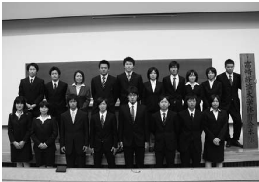
第43期体育会本部長

この体育会の恩恵をよりたくさんの体育会員が得られることを目標に、これからもっと体育会の環境整備や支援を行っていきたい。また体育会だけでなく、他の学生団体とも協力して高崎経済大学の発展に寄与したい。