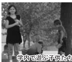
学内で遊ぶ子供たち

大学の施設も非常に充実しており、水泳やバスケット、バドミントン、テニス、トレーニングジムなどの運動が自由にでき、映画の上映も行っているので空き時間には本当に困りませんでした。