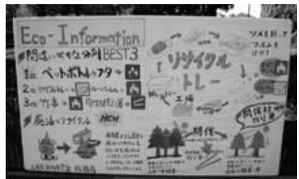
↑三扇祭の環境対策を紹介する看板