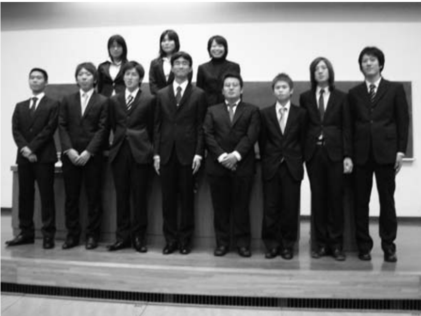
第37期議長団本部役員

第37期は「彩」というテーマを掲げました。これは各サークル・本部ともに独自の色(=彩)を引き出し共有・協調させていくことで文サ全体が一体となって発展していこうという意味です。このテーマの達成の為に精一杯努力して参りますのでこれからどうぞ宜しくお願い致します。