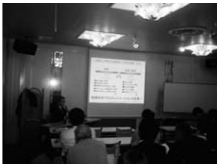
人材育成セミナー