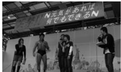
↑お笑いライブ「笑撃!!～元気があれば何でもできる～」は生の芸人を目見ようと、たくさん市民が来場してくれました。