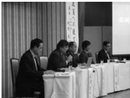
キックオフ・シンポジウム

これまでに、キックオフシンポジウムの開催(平成20年11月)、まちなみ景観とユニバーサルデザインや各種調査及び地域人材育成セミナー(平成21年1月～2月)『高崎元気再生人材育成セミナー—高崎ブランドの創出に向けて—』の開催などの取組が行われている。