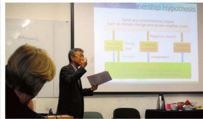
ロンドン大学SOAS校研究会での発表