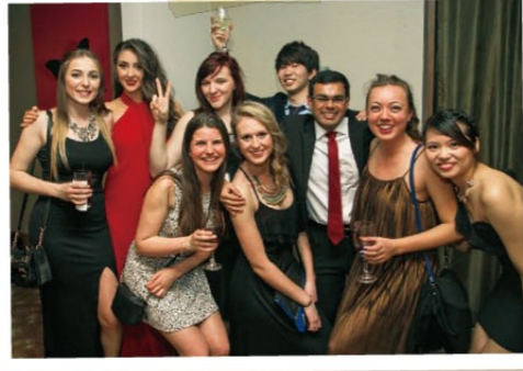
大学クラブの授賞式