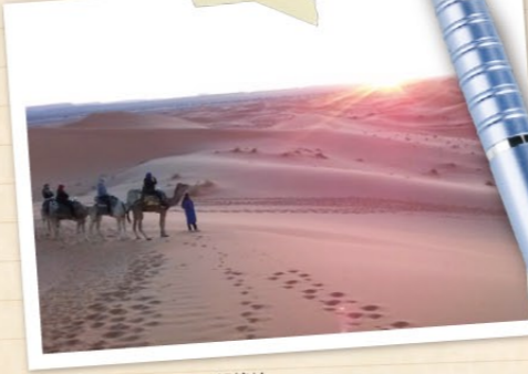
モロッコ、サハラ砂漠の朝焼け