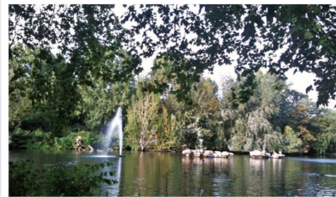
セント・ジェームズ・パーク(よく見るとペリカンが・・・)