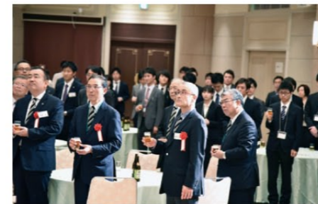
就職相談会in東京(交流会)

参加した学生たちは、出身地の枠を超え積極的に情報交換を行い、就職活動への不安を解消することができ、意気込みを新たにしました。また、例年このイベントは同窓生との交流だけでなく、改めて地元を見つめ直し、就職活動の視野を広げる良いチャンスとなっています。