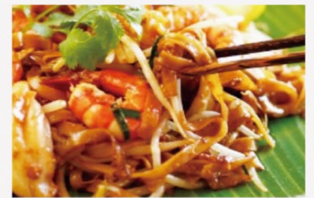
チャー・クイティオ

観光地以外では、ペナン島の食べ物も有名です。ペナンの料理は首都のクアラルンプールの料理に比べるとあっさり目の味付けが多くて、素材の旨みを大事にしています。それがペナンはクアラルンプールより食の都として有名な理由だと思います。ラクサ、ホッケンミー、チャー・クイティオ、チェンドルとオタオタはペナン子のこだわりが詰まったペナンのマスト・トライ料理です。