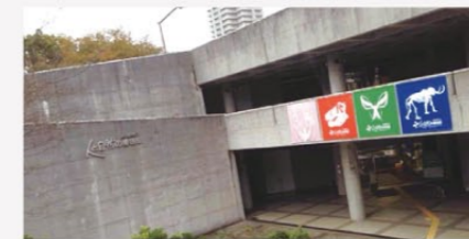
「ひとく」の愛称で親しまれる三田市にある博物館

また家の近くに、100万点を超える収蔵資料をもつ公立博物館があり、何度か訪れていたのですが、この博物館が国内最大級のものだと大学の講義の課題で調べていた際に初めて知り、20年近く住んでおきながら知らなかったことに恥ずかしさを覚えました。