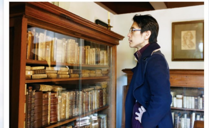
取材で訪れたオランダ・リンスプルフに残るスピノザの書斎にて