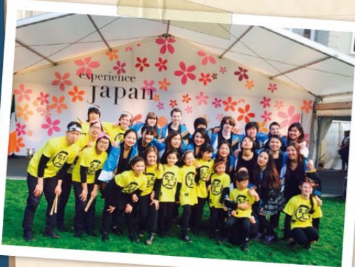
日本を紹介するイベントでソーラン節の披露

最後になりましたが、交換留学に参加させて頂いたこと、この留学に関わって頂きましたすべての皆様に心から感謝申し上げます。