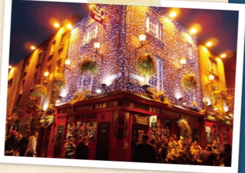
ダブリン中心街の日常