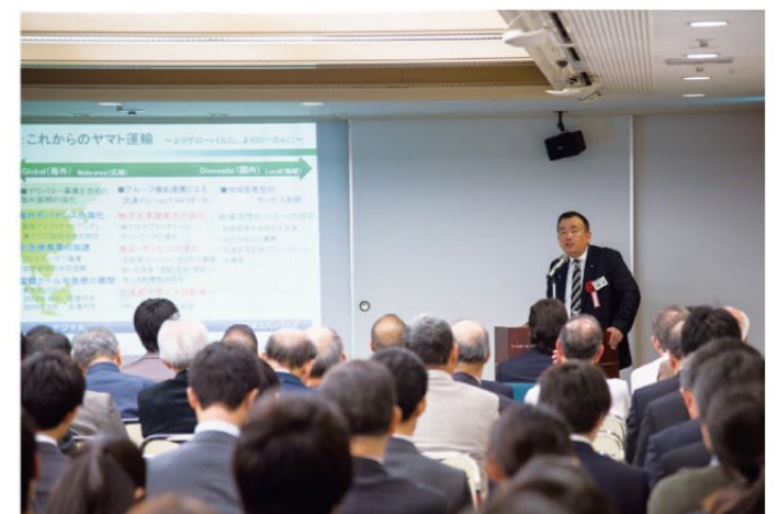
インタビューの後は、満席の会場で講演をいただきました