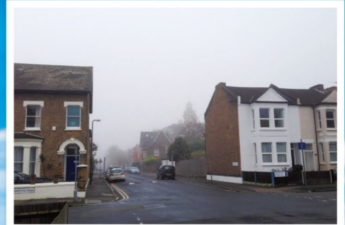
自宅付近。霧で有名なロンドンでも驚かれる程の濃霧だった日の撮影