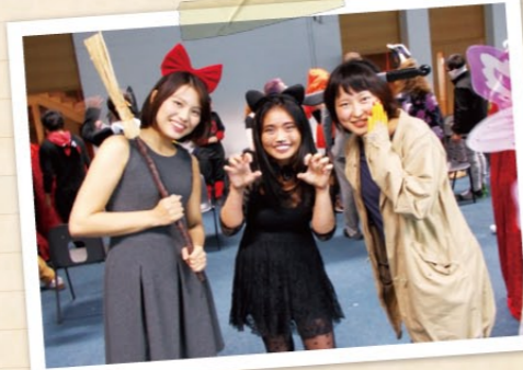
ハロウィンパーティー