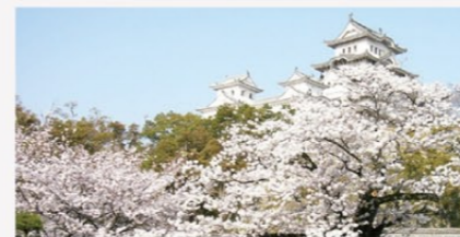
約10年前に訪れた際に撮った姫路城

兵庫は関西なので関西弁が話されていますが、県の中でも神戸弁や播州弁等、地域独自の方言もあります。