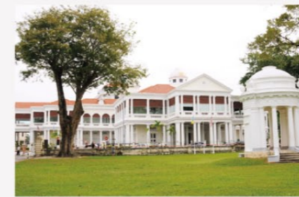
セント・ジョージ協会

また、ペナン島は「東洋の真珠」と呼ばれます。18世紀に英国領となったことで、以前のイギリス植民地時代の建物や様々な文化が融合した独特の町並みがペナンの魅力です。そのような独特な町であるジョージタウンは、2008年に世界文化遺産に登録されました。