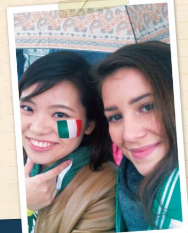
聖パトリックの祝日で友人と