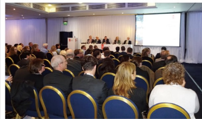
シンポジウムでのパネルディスカッション